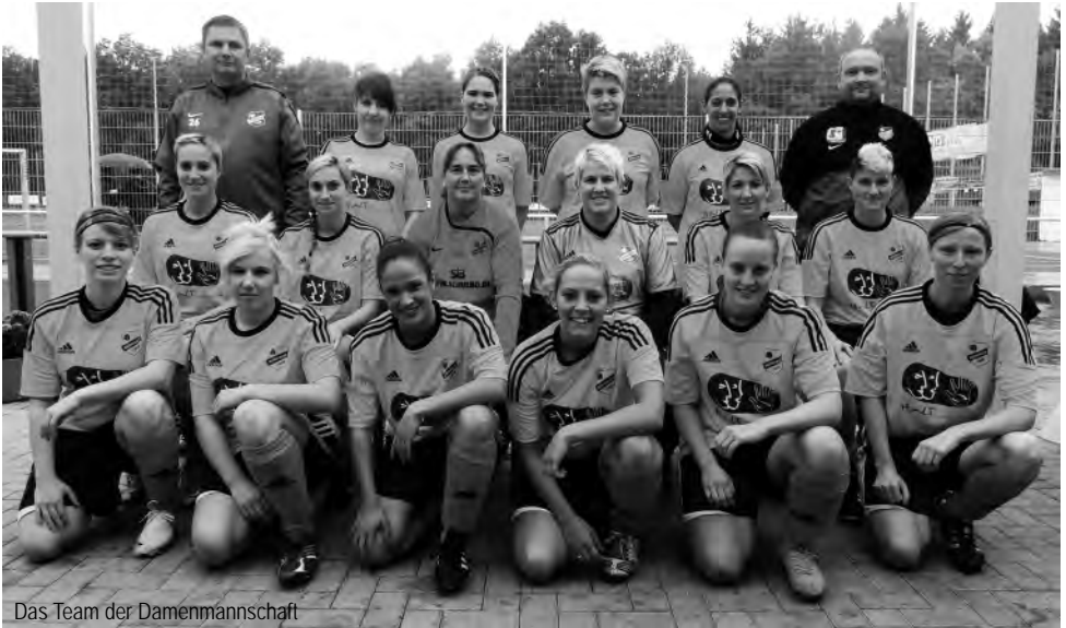
Das Team der Damenmannschaft

So, dann wollen wir das Jahr mal angehen. Die „Bürwer Damen“ wünschen dabei allen ein gutes Gelingen und vor allem Gesundheit !!!