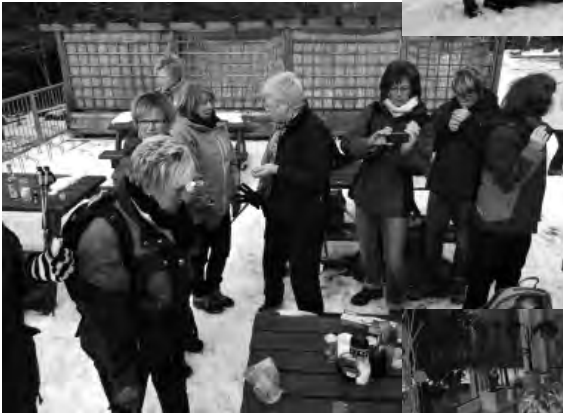
Zum Abendessen ging es in den Gasthof Merje nach Kredenbach