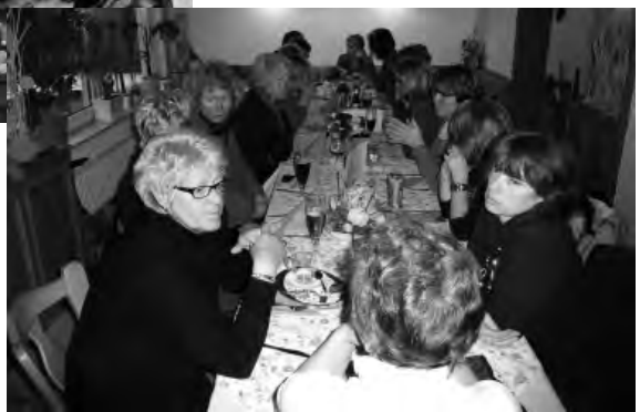
... und im Oktober ging es dann von Dreistiefenbach nach Kredenbach

(wegen des Regens haben wir alle vergessen unsere Fotoapparate aus-zupacken ... schön war es trotzdem)