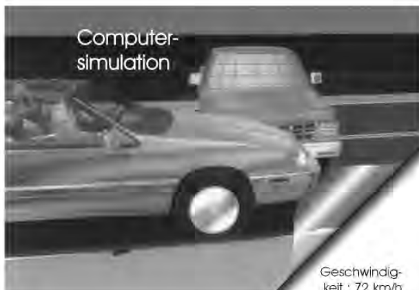
Geschwindigkeit : 72 km/h

57439 Attendorn Kölner Str. 76 Telefon : 0 27 22 - 93 83 0 Fax : 0 27 22 - 93 83 23 Email: TUE@Kneifel.de