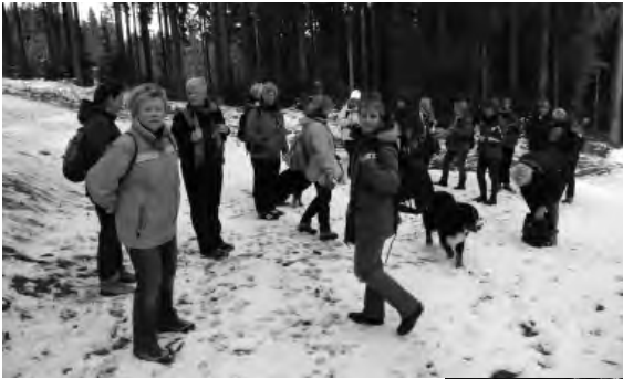
Oberhalb von Müsen machen wir unsere erste Rast

Kleine Eindrücke vom Frauen-Wandertag am 16. März 2013: Bei schönstem Winterwetter ging es auf den 14 Kilometer langen Kindelsbergpfad.